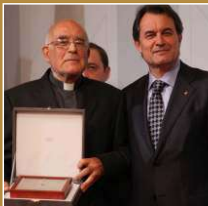
Creu de Sant Jordi 2011